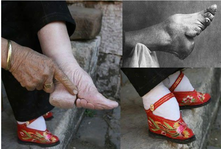
Práctica cultural: Pies de Loto, CHINA